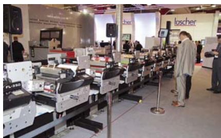
Flexotiskový stroj Edale FL-350

● V letošním roce podzimní Lipsko nepatřilo pouze výstavě PostPrint 2011, která se do tohoto města přesunula poprvé z Berlína, ale ve svém výrobním závodu zde na začátku listopadu pod názvem Postpress Commercial Days 2011 uspořádala svůj open-house také společnost Heidelberg .