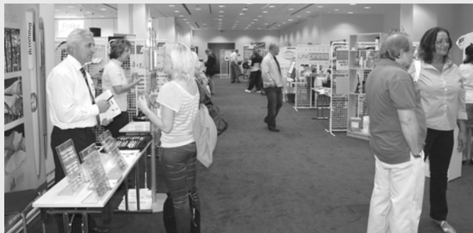
Letošní ročník veletrhu Svět reklamy se opět uskutečnil ve dvou sálech hotelu Diplomat v Praze

Tomuto zaměření odpovídalo i oborové členění letošního ročníku veletrhu Svět reklamy, na kterém celkem 65 vystavovatelů prezentovalo ve svých stáncích, umístěných ve dvou sálech hotelu Diplomat, kreativní novinky ze své nabídky. Z oblasti tiskového průmyslu se veletrhu jako vystavovatelé zúčastnily například tiskárny Unipress z Turnova, Grafico, Bittisk a Rayfilm z Opavy, Žaket z Prahy nebo Polypress z Karlových Varů.